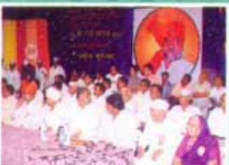
संस्थेचे संस्थापक, अध्यक्ष यांच्या ४७व्या वाढदिवसानिमित्त उपस्थित मान्यवर