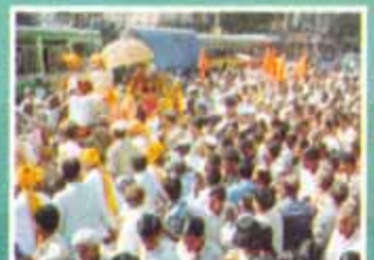
संस्थेने आयोजित केलेल्या परमपूज्य गगनगिरी महाराजांच्या भिरवणुकीस उपस्थित जनसमुदाय