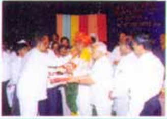
माननीय संस्थापक, अध्यक्ष यांचा सत्कार करताना सातारा सहकारी बँकेचे अध्यक्ष व संचालक मंडळ