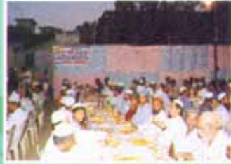
संस्थेने आयोजित केलेल्या इभितहार पार्टीत उपस्थित सभासद वर्ग