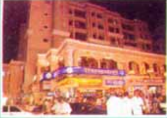
अहवाल सालात संस्थेची खरेदी केलेली नवीन वास्तू कोपरखैराणे शाखा