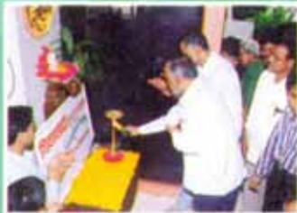
संस्थेच्या खेतवाडी शाखेचे ३६५ दिवस व सलग १२ तास सेवेचे उद्घाटन करताना माननीय अध्यक्ष