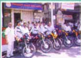
संस्थेच्या प्रतिनीधींना गाड्यांचे वाटप करताना माननीय अध्यक्ष