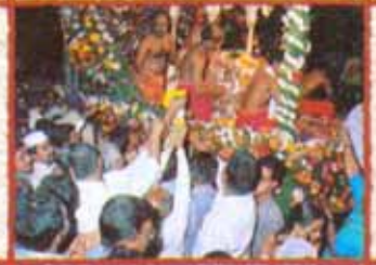
नागेश्वर पालखी सोहळ्याप्रसंगी भव्य स्वागत करताना