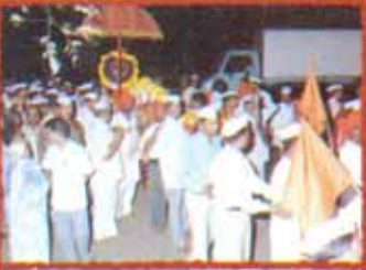
समर्थ रामदास स्वामी प्रचार दीन्याप्रसंगी काढण्यात आलेली स्वामींच्या पादुकांची भव्य मिरवणुक