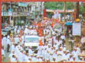
डोबिवली शाखा उद्घाटनप्रसंगी आयोजित केलेल्या पांडुरंगाच्या दिंडीस उपस्थित जनसमुदाय.