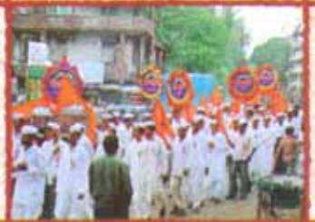
पांडुरंग दिंडीमधील सहभागी संस्थेचा कर्मचारी वर्ग.