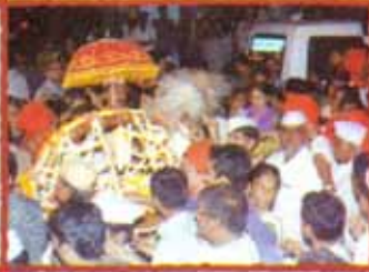
स्वामी समर्थींच्या पालखी सोहळ्याचे भव्य स्वागत करताना