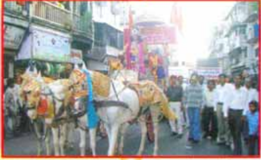
नववर्षाच्या निमित्त काढलेल्या स्वागत यात्रेत संस्थेतील परिवारांचा सहभाग