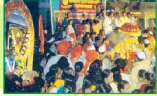
श्री स्वामी समर्थ यांच्या पालखी सोहळ्यात सहभागी झालेला शिवसह्याद्री परिवार