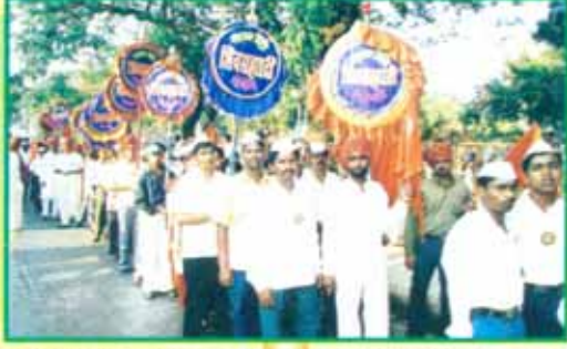
ठाणे शाखेच्या उद्घाटन प्रसंगी ठाणे शहर विभागातून शिवसह्याद्री परिवाराची काढलेली प्रभात फेरी