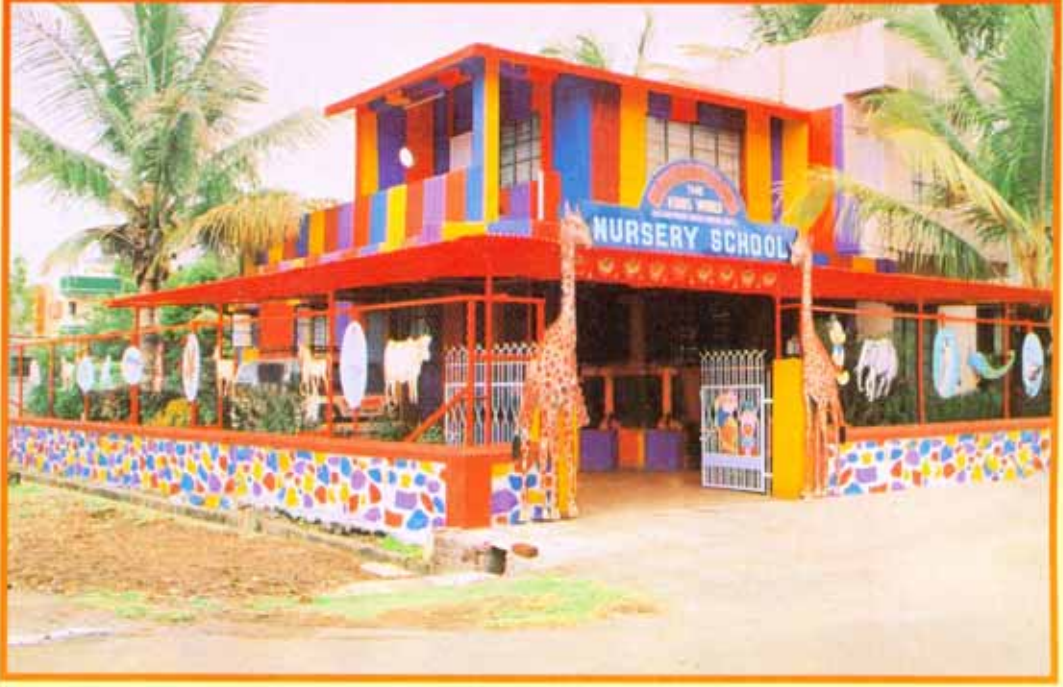
शिवसहयात्री परिवाराच्यावतीने सातारा या ठिकाणी सुरु केलेले किडस् वर्ल्ड