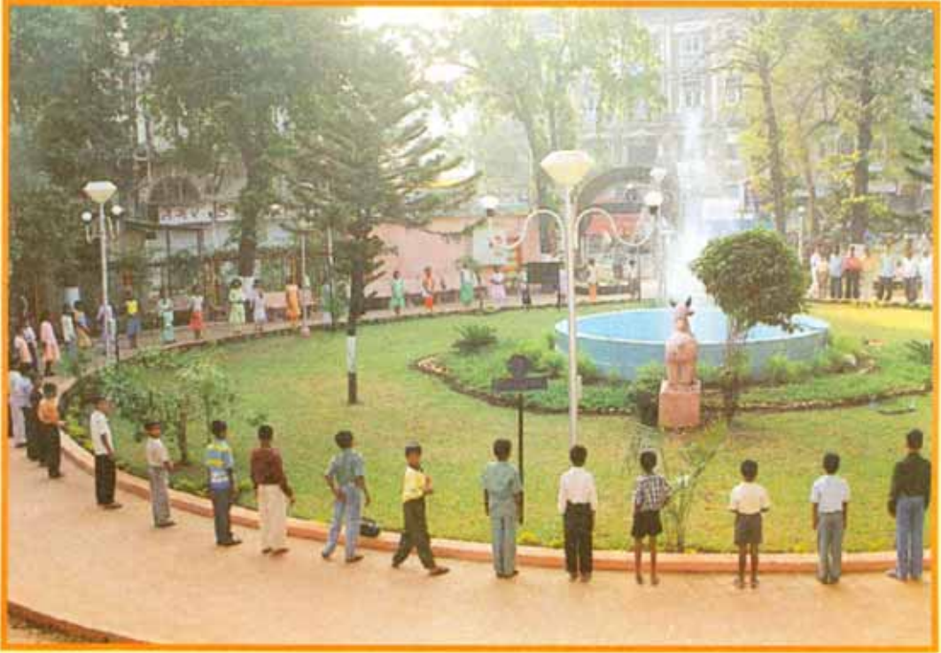
संस्थेच्या वतीने विकसीत करण्यात आलेले राजाराम बापू सुर्यवंशी उद्यान खेतवाडी