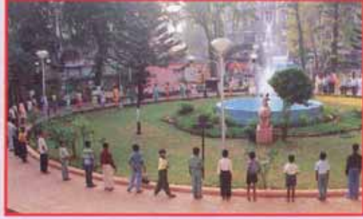
शिवसहाद्री परिवाराने विकसीत केलेले गार्डन (उद्यान)