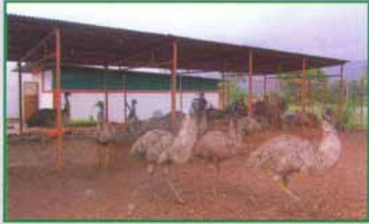
शिवसहाद्री इमू प्रकल्प

संपूर्ण भारतात धावणारी ऑक्सिजनसह वातानुकूलीत रुग्णसेवा मोबाईल नं. ९३२२२३१५७५/९८६९९६९२१५