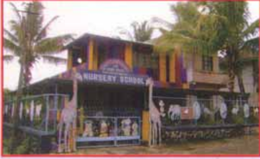
शिवसहाद्री परिवारांच्या वतीने सातारा या ठिकाणी सुरु केलेले किड्स वर्ल्ड (नर्सरीस्कूल)