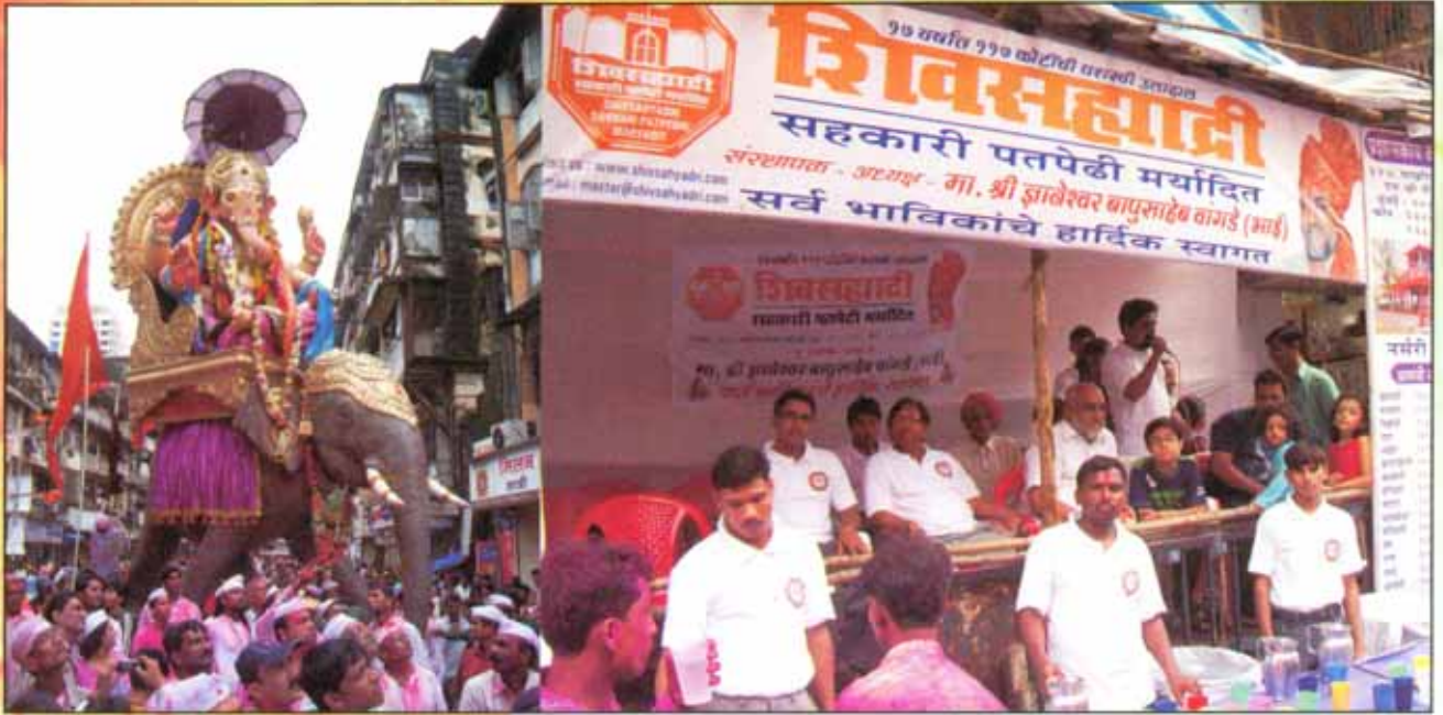
अनंत चतुर्थी दिवशी गणेश विसर्जनात सहभागी होऊन पाणी वाटप करताना शिवसहाद्री परिवार