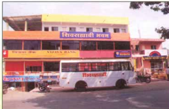
संस्थेचे सातारा विभागातील शिवसहाद्रीभवन