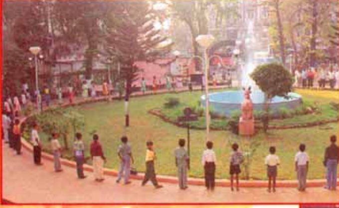
शिवसहाद्री परिवाराने विकसीत केलेले गार्डन (उद्यान)

शिवसहाद्री परिवारांच्या वतीने सातारा या ठिकाणी सुरु केलेले स्कूल