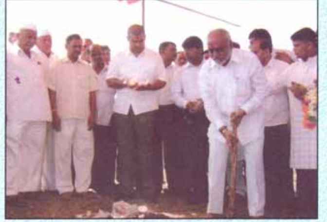
शिवसहाद्री परिवार आयोजित वृक्षारोपण सोहळा