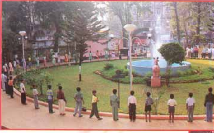
शिवसहाद्री परिवाराने विकसीत केलेले गार्डन (उद्यान)

शिवसहाद्री परिवारांच्या वतीने सातारा या ठिकाणी सुरु केलेले स्कुल