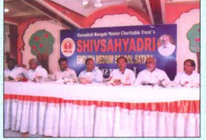
शिवसहाद्री इंग्लीश मिडियम स्कूल स्नेहसंमेलन क्षणचित्रे