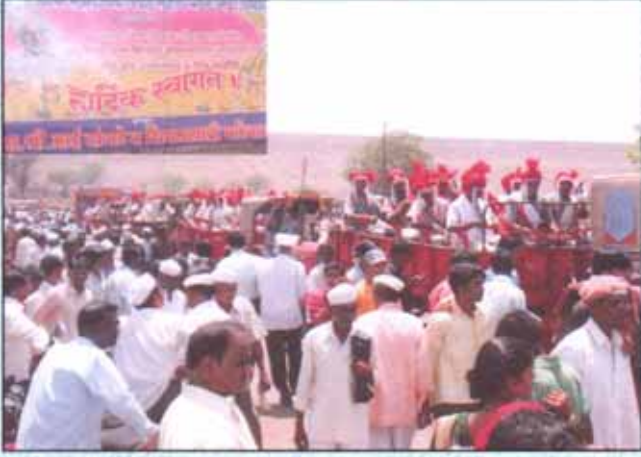
सामुहिक विवाह सोहळा क्षणचित्रे