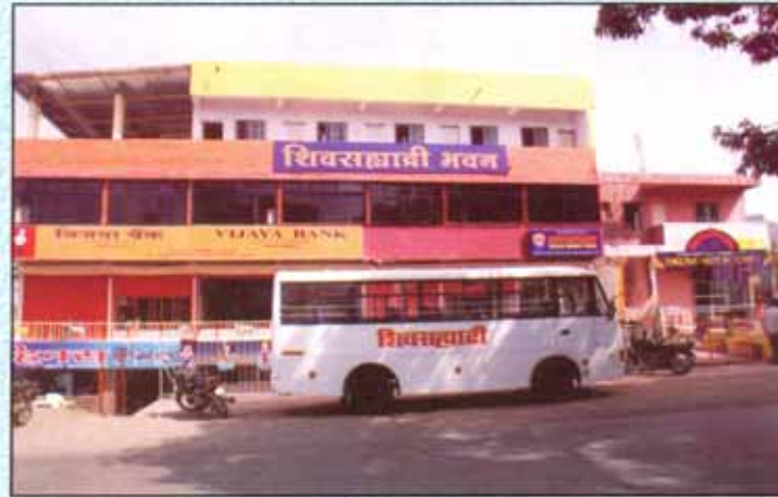
संस्थेचे सातारा विभागातील शिवसहाद्री भवन