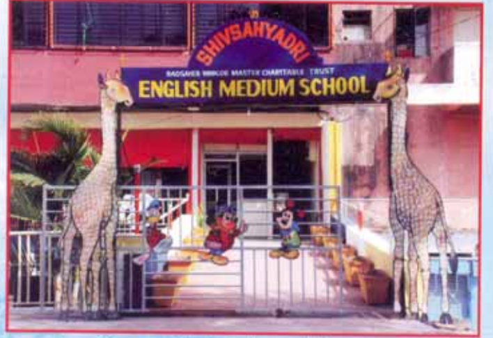
शिवसहाद्री परिवारांच्या वतीने सातारा या ठिकाणी सुरु केलेले स्कुल