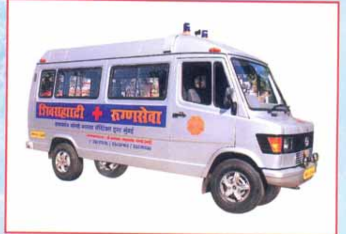
संपूर्ण भारतात धावणारी ऑक्सिजनसह वातानुकूलीत रुग्णसेवा मोबाईल नं. ९३२२२३१५७५/९८६९९६९२१५