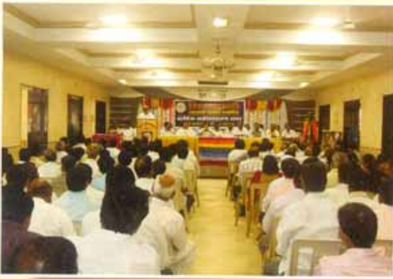
२० व्या वार्षिक सर्वसाधारण सभेस उपस्थित सभासद वर्ग