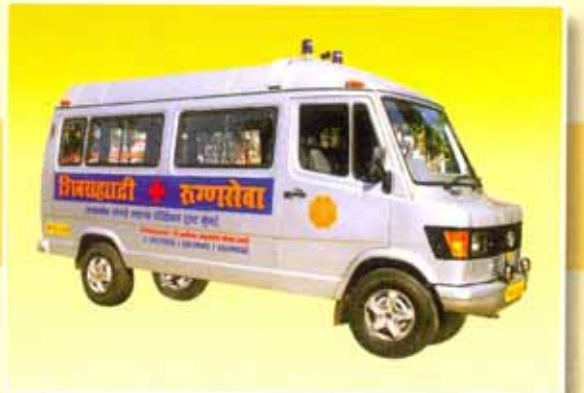
संपूर्ण भारतात धावणारी ऑक्सिजनसह वातानुकूलित रुग्णसेवा मोबाईल नं. ९३२२२३१५७५/९८६९९६९२१५