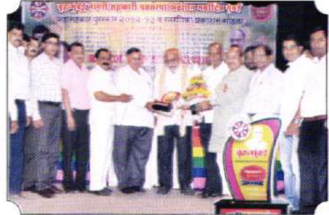
अहवाल मुल्यमापन स्पर्धा सन २०१२-१३ या स्पर्धेतील पारितोषक स्विकारताना संस्थेचे संस्थापक व शिवसह्याद्री परिवार.