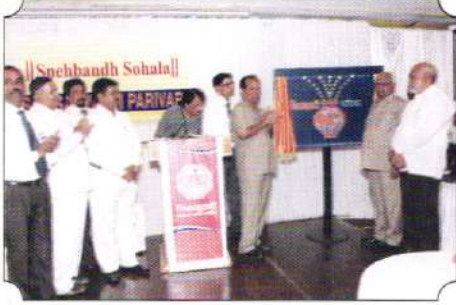
संस्थेच्या स्नेहबंध सोहळा या कार्यक्रमाचे उद्घाटन करतेवेळी उपस्थित असलेले संस्थेचे पदाधिकारी व मान्यवर