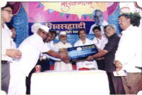
संस्थेच्या ए.टी.एम. कार्डचे उद्घाटन करताना मान्यवर तसेच संस्थेचे संस्थापक व अध्यक्ष.