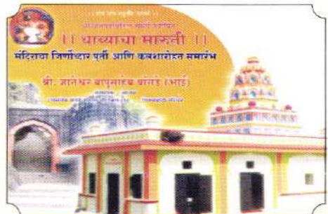
शिवसह्याद्री परिवाराने सज्जनगडावरील जिर्णोद्धार केलेले धाव्याचा मारुती मंदीर