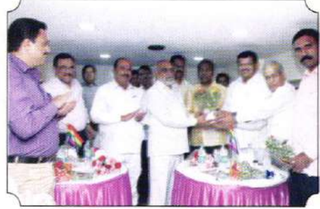
शिवसह्याद्री ए.टी.एम. सेंटरच्या उद्घाटन प्रसंगी जमलेले इतर संस्थांमधील मान्यवर