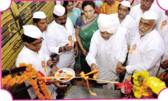
संस्थेच्या पुणे शाखेचे उद्घाटन करताना ह.भ.प. बाबा महाराज सातारकर व इतर मान्यवर