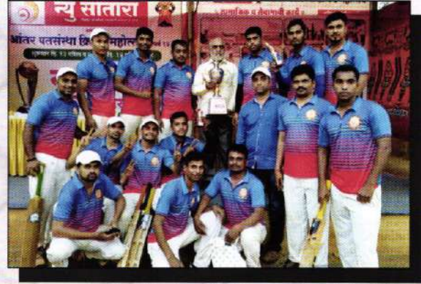
न्यु सातारा सहकारी पतपेदी यांच्या लॉफे भरविण्यात आलेल्या अंतर्गत क्रिकेट सामन्या मधील शिवसह्याद्री क्रिकेट संघाने द्वितीय क्रमांक पटकविलेला संघ व आदरणीय भाई