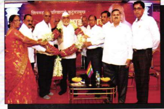
शिवसहाद्री संस्थापक यांचा ६२ वा वाढदिवस साजरा करताना संचालक मंडळ