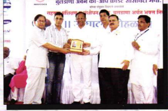
संपूर्ण महाराष्ट्रात, महाराष्ट्र राज्य सहकारी पतसंस्था फेडरेशन यांचेकडून आपल्या संस्थेला मिळालेला द्वितीय क्रमांकाचा "दिपस्तंभ पुरस्कार" स्विकारताना संस्थेचे संचालक व महाव्यवस्थापक