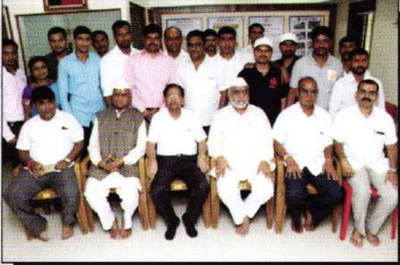
संस्थेच्या २८ व्या मेढा शाखा उद्घाटन प्रसंगी उपस्थित असलेले संचालक, अधिकारी व कर्मचारी