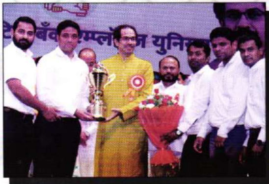
शिवसेना पक्षप्रमुख मा. श्री. उध्दवजी ठाकरे यांच्या हस्ते को-ऑप. बँक एम्प्लॉईज युनियन मुंबईच्या ५८ व्या वर्धापन दिनानिमित्त आयोजित करण्यात आलेल्या आंतरसहकारी बँक क्रिकेट स्पर्धा २०१८ चे "अंतिम विजेता संघाचा पुरस्कार" स्विकारताना शिवसहाद्री क्रिकेट संघ