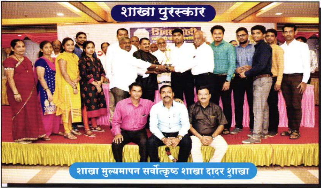
₹ ५ कोटीपेक्षा जास्त समिश्र व्यवसाय करणाऱ्या शाखा मधुन